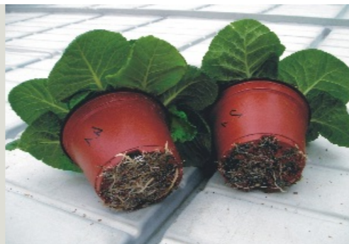
foto: links bemest met Kristalon met Super FK, rechts bemest met Kristalon zonder Super FK

Kristalon is al meer dan 40 jaar de marktleider in wateroplosbare, samengestelde, meststoffen. Kristalon staat al jaren voor de beste prijs/kwaliteit verhouding. Productontwikkeling en vernieuwing zijn nauw verbonden aan de naam Kristalon. Dit heeft geleid tot het inbouwen van een ander succesproduct van Yara in de Kristalon: Super FK. In 2005 werd de Kristalon Vega geïntroduceerd, gevolgd door de Kristalon Gena en dit jaar komt daar de Kristalin Arbora bij. In alle drie de formules is het fosfaat gedeeltelijk vervangen door Super FK. In de Kristalon Vega en Gena voor 50% en in de Arbora zelfs voor 75%. De eerste twee producten zijn speciaal ontwikkeld voor de vegetatieve en generatieve stadia van potplanten terwijl de samenstelling van Kristalon Arbora afgestemd is op de toepassing in boomkwekerij gewassen. Veel kwekers hebben de voordelen van Super FK al ervaren: meer groei, een beter wortelgestel, een diepere groene bladkleur en meer groeienergie. Bij erkende proefstations werden deze eigenschappen, in onafhankelijke proeven, aangetoond. Yara is er in geslaagd de voordelen van Super FK en Kristalon te combineren in één product. Een voordeel bij het gebruik van Kristalon met Super FK is, dat aanzuren niet noodzakelijk is, mits de waterkwaliteit goed is. Uitgebreide praktijk en laboratoriumtesten hebben aangetoond dat Kristalon Vega, Kristalon Gena en Kristalon Arbora dezelfde positieve eigenschappen bezitten als Super FK.