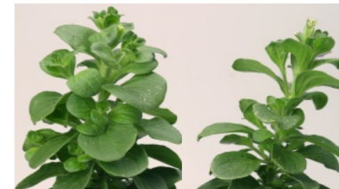
Foto: links bemest met Kristalon met Super FK, rechts bemest met Kristalon zonder Super FK

De uiteindelijke baksamenstelling is afhankelijk van gewas, groeistadium, waterkwaliteit en andere omstandigheden.