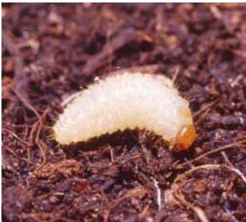
Larve van taxuskever (ca. 1 cm)