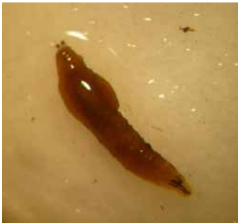
Larve geïnfecteerd door aaltjes