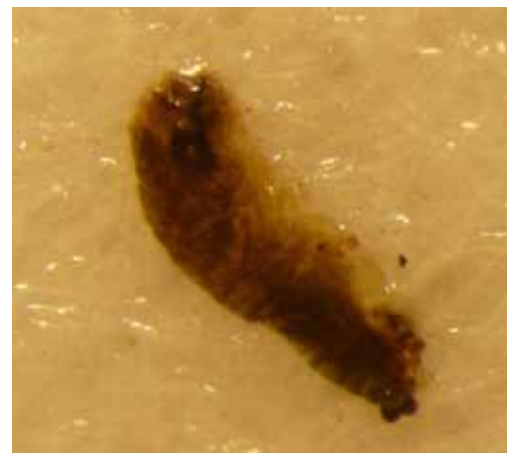
Larve gedood door aaltjes

Werkingsmechanisme: Nemasys ® C bestaat uit insectenparasitaire aaltjes van de soort Steinernema carpocapsae . De aaltjes lossen goed op in water. Via aangieten, broezen of verspuiten worden de aaltjes toegediend.