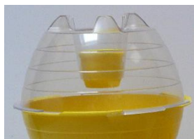
Stop de lokstofhouder in de transparante bovenkant.