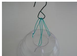
Op drie punten omhoog trekken en aan haak vastmaken.