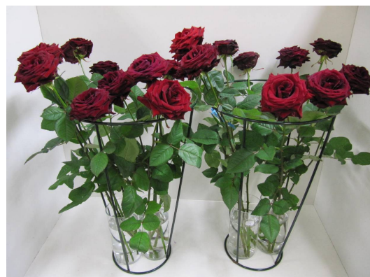
Behandeling: Chrysal Grow 20 als voorbehandelings- middel en tijdens transportfase / water tijdens winkel- en consumentenfase