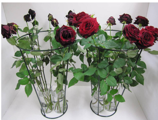
Behandeling: water tijdens transport-, winkel- en consumentenfase