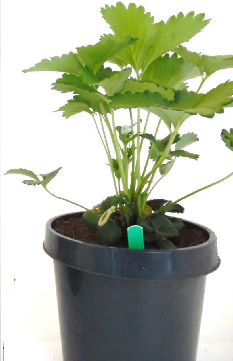
Aardbei - bovengrondse groei