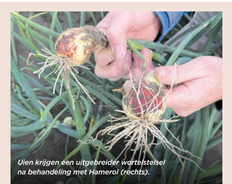
Uien krijgen een uitgebreider wortelstelsel na behandeling met Hamerol (rechts).