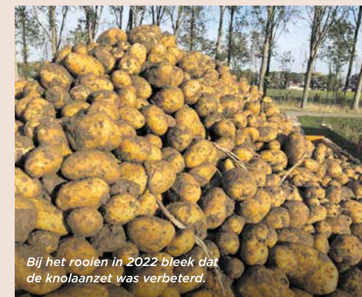
Bij het rooien in 2022 bleek dat de knolaanzet was verbeterd.

“Dit product valt onder de gewasbeschermingsmiddelen en niet onder de meststoffen, zoals biostimulanten”, aldus Den Hollander. “Er zijn veel groene middelen op de markt. Het is hierbij belangrijk om het kaf van het koren te scheiden. Wij laten veel proeven uitvoeren door onderzoeksinstituten om zo meer te weten te komen